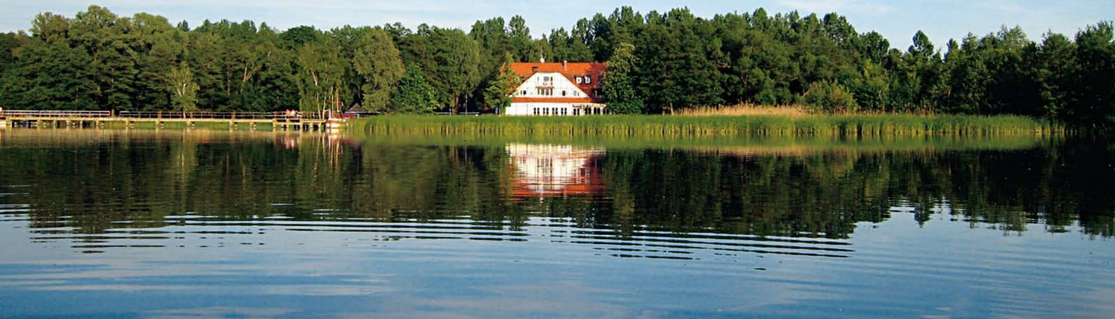
Wald- und Seegut Kremmen · Zum See 4a · 16766 Kremmen (nördl. von Berlin) · Tel.: 033055/220 80