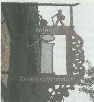
Tourismus ist für Irina Hentzschel ein wichtiges Thema.