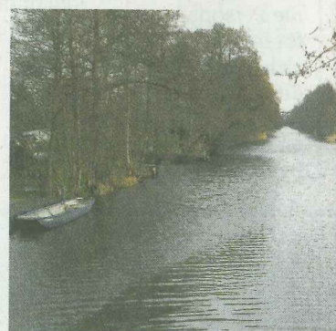
Der Lange Trödel soll demnächst verb...