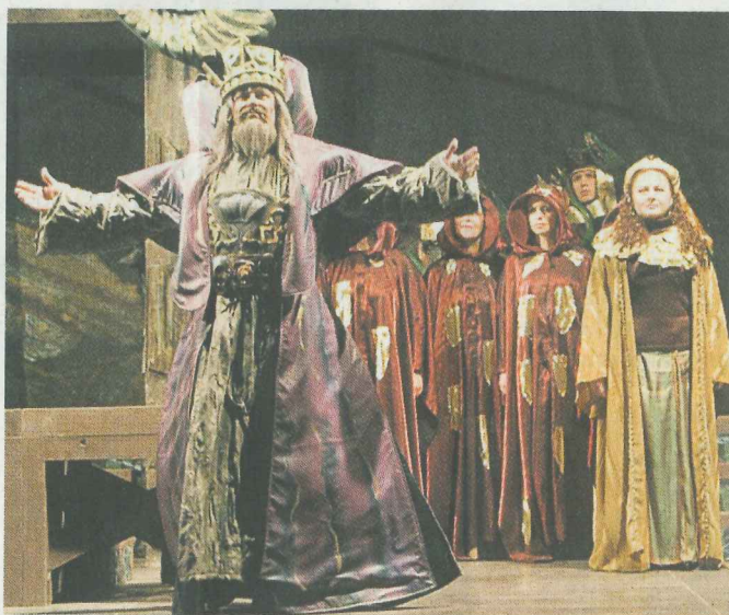
Verdis Oper wird direkt am See aufgeführt.

Das Orchester soll sich neben der Bühne befinden, gespielt wird in zwei Teilen. Das Team der Seelodge sorgt für die Verpflegung der Gäste.